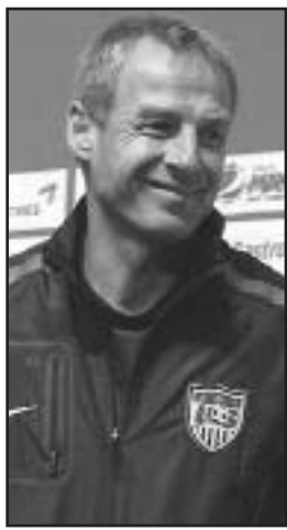
Jurgen Klinsmann Onyewu (Sporting Lisboa/Portugal).