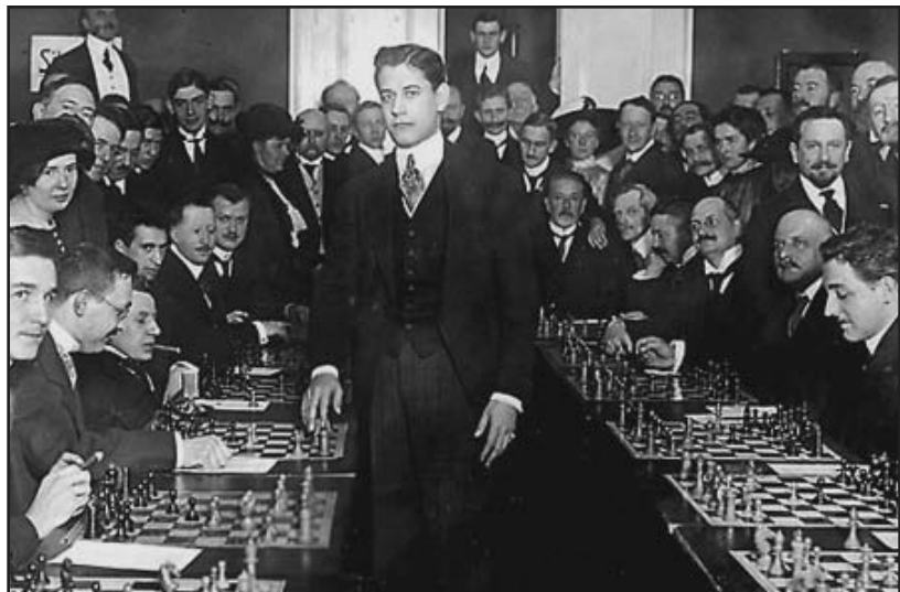
José Raúl Capablanca y Graupera (La Habana, 19 de noviembre de 1888 - Nueva York, 8 de marzo de 1942), el mejor ajedrecista latino de la historia y uno de los mejores de todos los tiempos, campeón mundial de ajedrez de 1921 a 1927